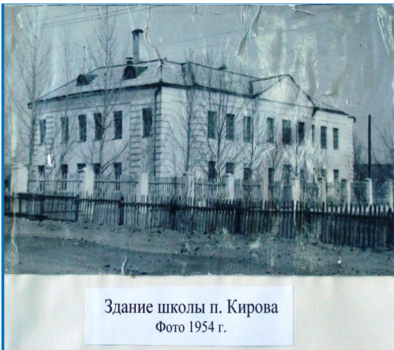
Здание школы п. Кирова Фото 1954 г.